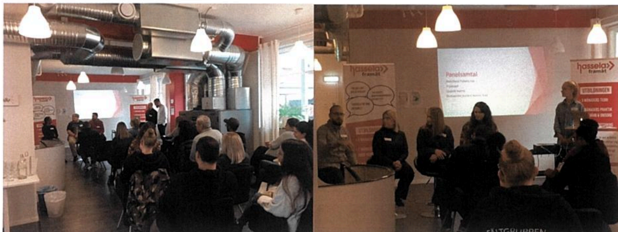
Bilder från årets kunskapshöjande seminarium, vintern 2021.

hur och varför hen valde att komma till Hassela och på vilka sätt det gjort skillnad för hen – ett moment som var väldigt uppskattat av alla som deltog.