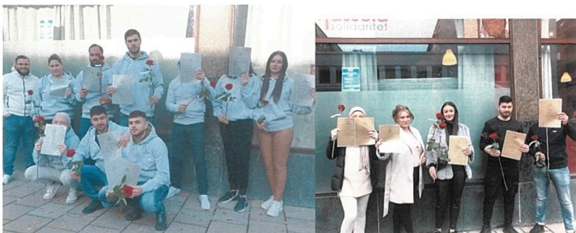
Bilder på grupp 34, årets sista grupp, efter avslutad teori respektive praktik, hösten och vintern 2021.

Under 2021 hann 4 grupper påbörjas och genomföras och 54 personer antogs och deltog i projektet. Vidare avslutades två grupper om 24 personer som påbörjade teori och praktik under 2020 men blev färdiga under 2021.