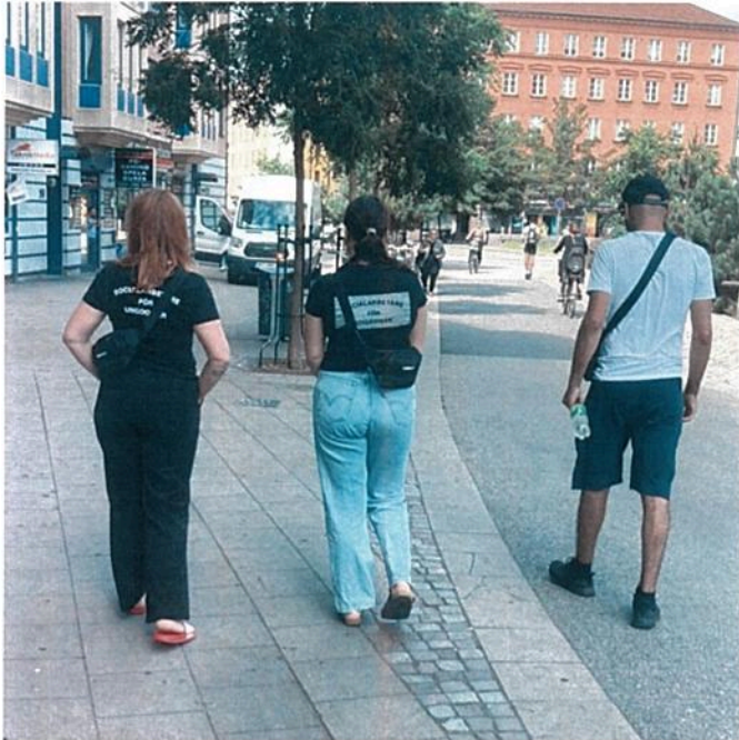
Fältande med deltagare från Movement och personal från Socialarbetare för Ungdomar, sommaren 2021.

Malmö, Socialarbetare för Ungdomar och Fältgruppen under delar av sommaren. Samarbeten med de uppsökande verksamheterna fortsatte i andra former än just fältarbete under året, t.ex med hjälp av fysisk och digitalt spridning av verksamheten inför kommande gruppstarter.